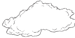
clouds las nubes