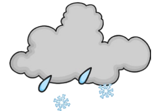
sleet la escarcha