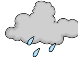
showers la lluvia