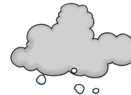
hail el granizo