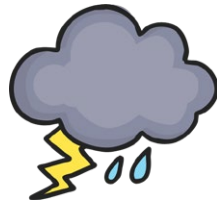
storm la tormenta