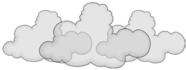
fog la niebla