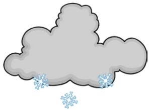
snow la nieve