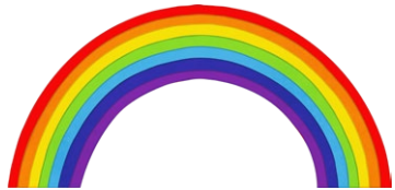
rainbow el arcoíris